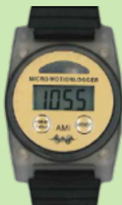
マイクロモーションロガー型 アクティグラフ