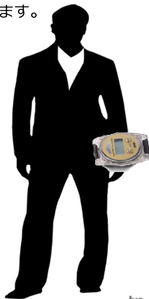
米国AMI社製マイクロ・モーションロガー型 アクチグラフ