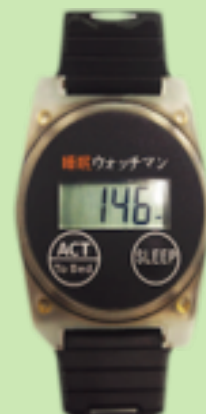
睡眠ウォッチマン型 アクティグラフ